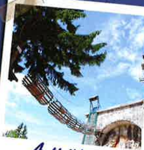
Activités au Fort des Rousses