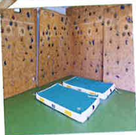
Salle de gym