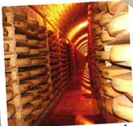
Caves d'affinage du Fort des Rousses...