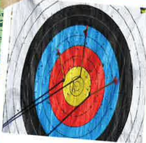
Tir à l'arc