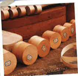
Boissellerie du Haut-Jura