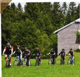
Balade en VTT