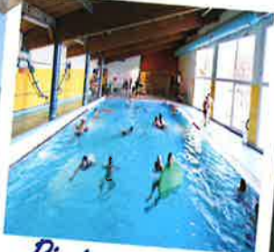
Piscine couverte et chauffée