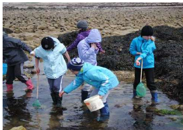
Pêche à pied