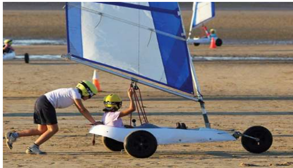
Char à voile