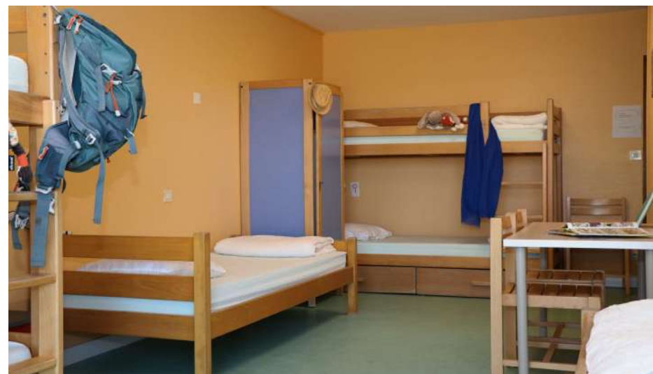
Une chambre d'enfants