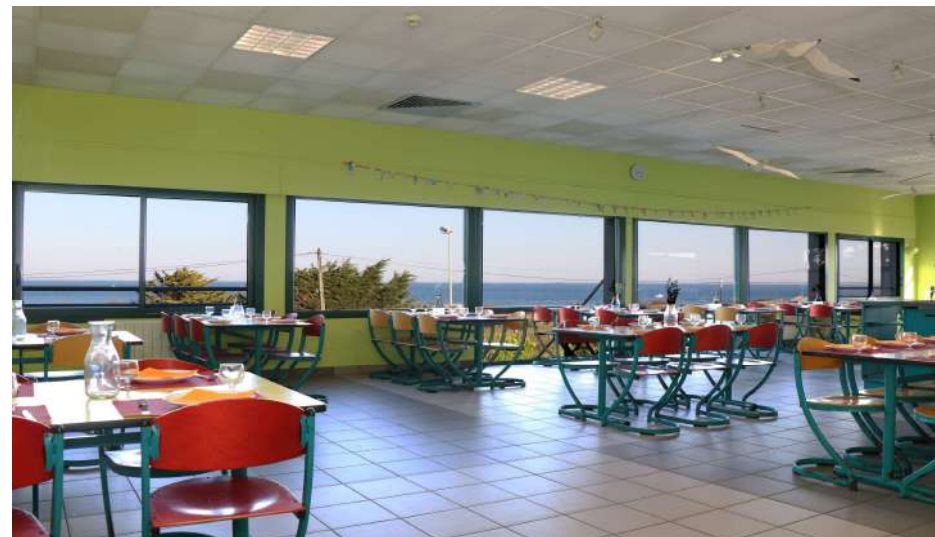
Salle à manger spacieuse