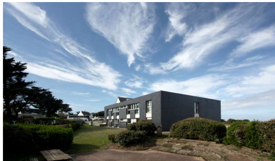
Le forum et l'hébergement « Teviec »