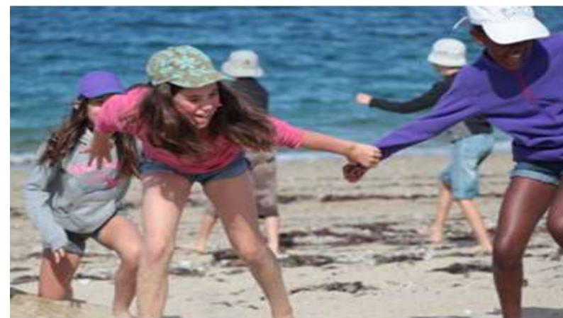
Jeux sur la plage