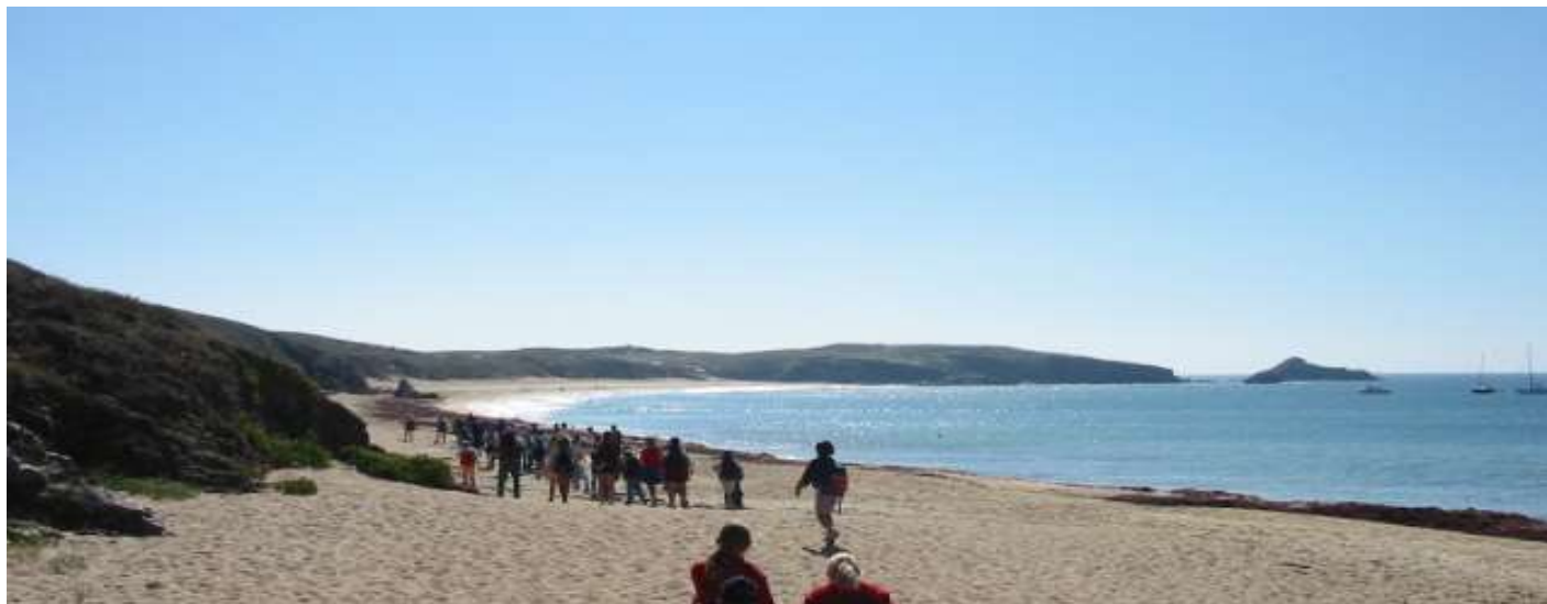
Sortie à la journée sur l'île d'Houat