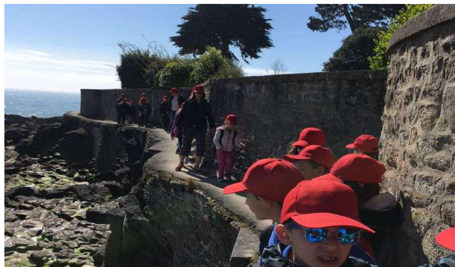
Petite randonnée côté baie

Consultez-nous pour en savoir plus sur les activités proposées.