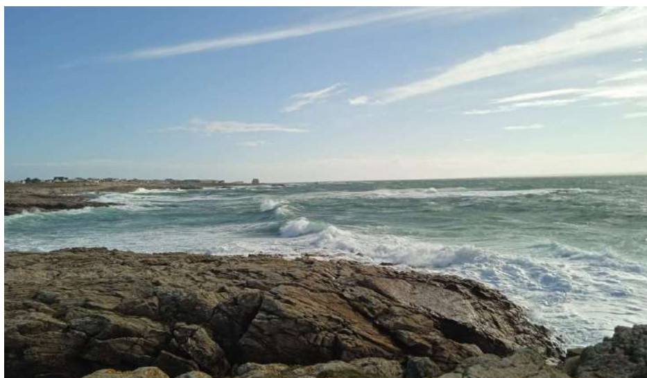
Côté océan, vue sur la côte sauvage