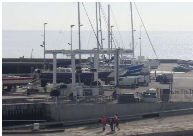
Découverte des activités portuaires