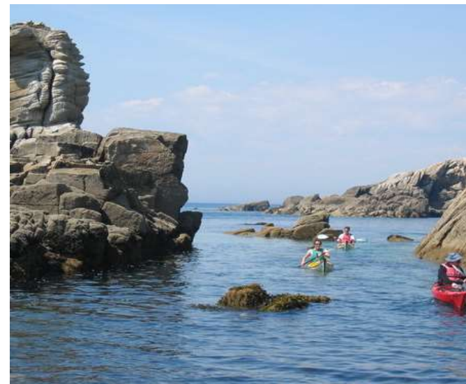
Kayak de mer