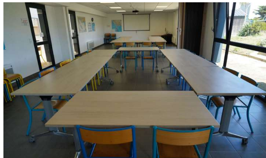
Salle de classe

Autres équipements Vidéoprojecteur Ecran vidéo Unité informatique