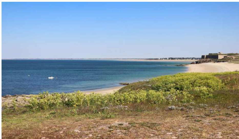
Côté océan, vue sur le fort de Penthièvre, les dunes de Gâvres