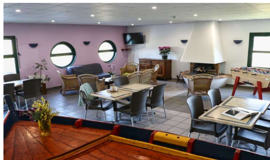
Salon commun : salle « bateau »