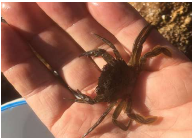
Observer, puis relâcher...