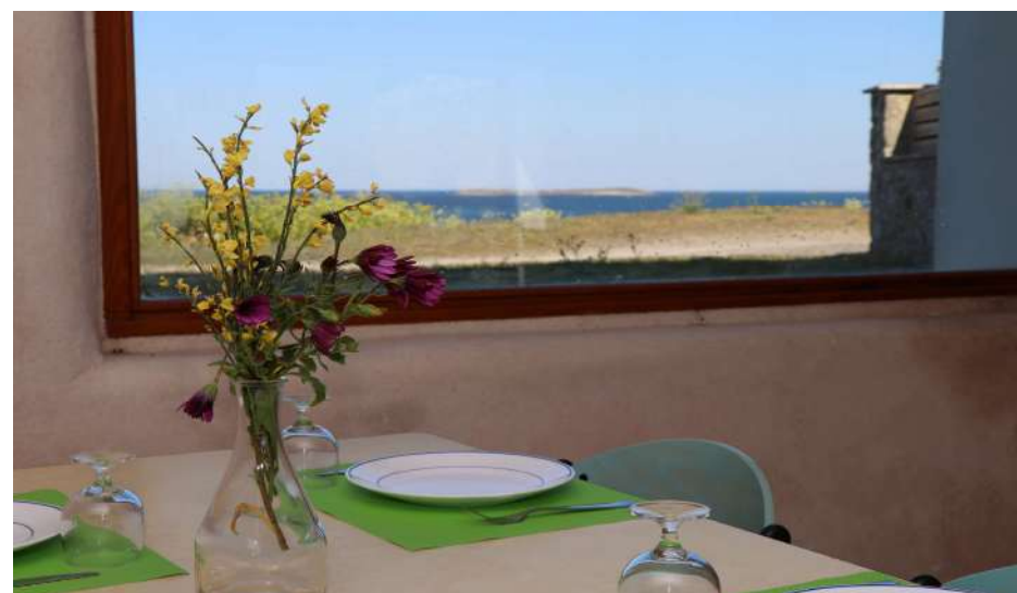
Salle à manger avec vue mer