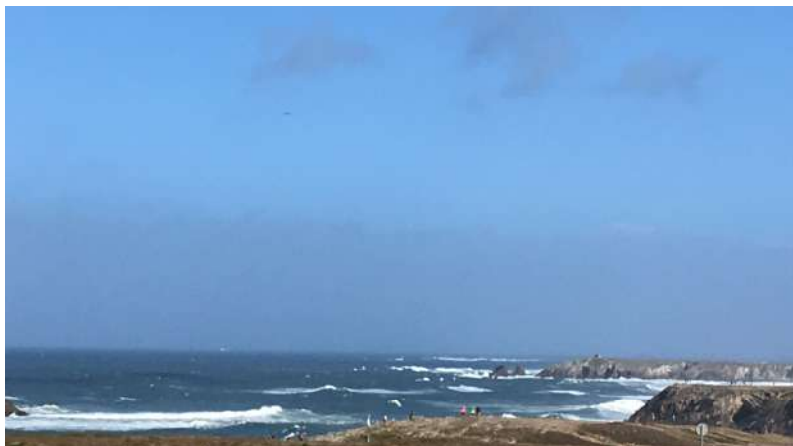
Randonnée « tempête » sur la côte sauvage