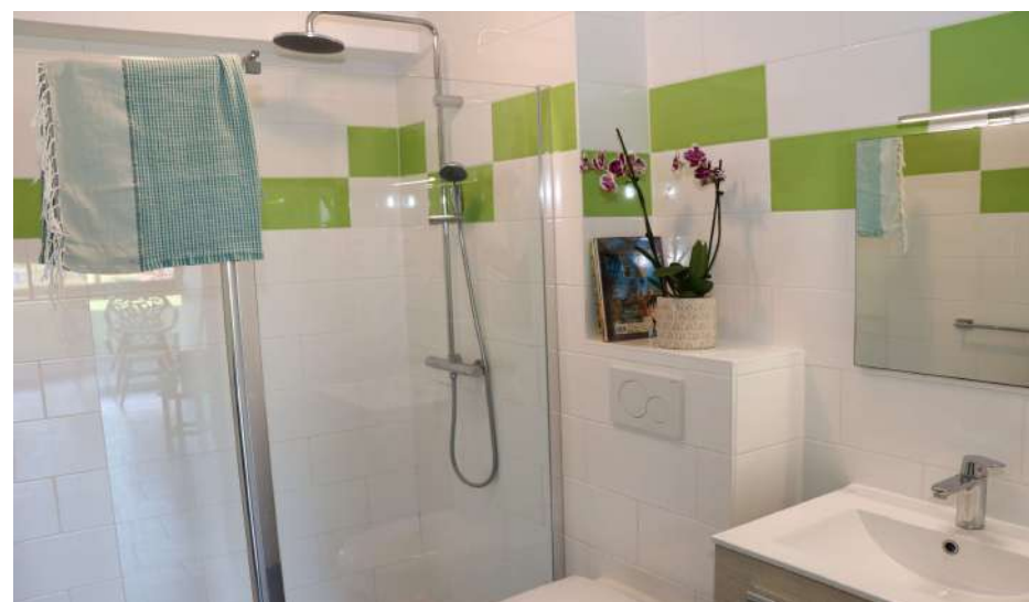
Salle de bain avec sanitaires