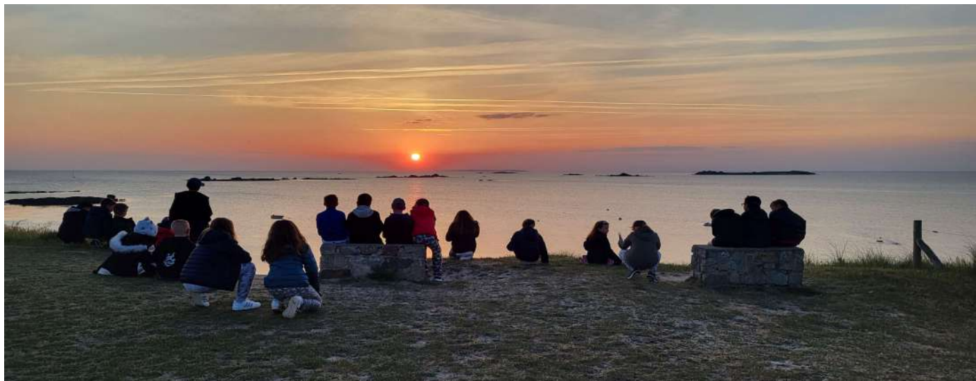
Côté océan, pour le couchant, ou côté baie pour le levant ?