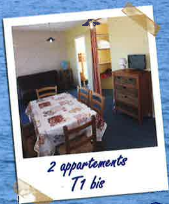
2 appartements T1 bis