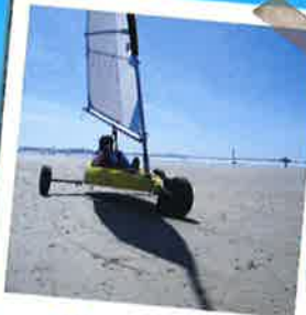
Char à voile