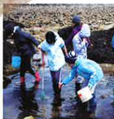
Pêche à pied