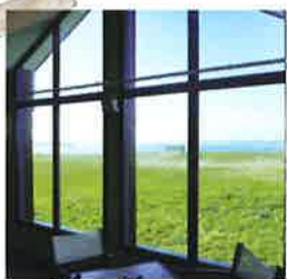
Magnifique vue panoramique