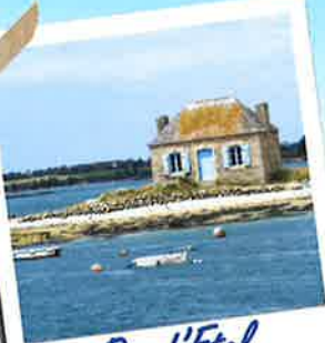
Ria d'Etel et Saint Cado