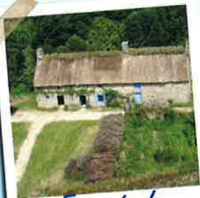
Ecomusée de St Dégar