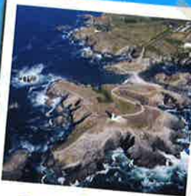
Belle Île en Mer