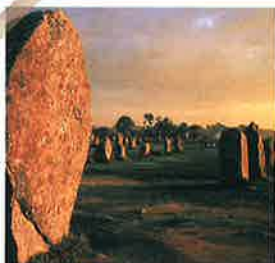
Alignements de Carnac