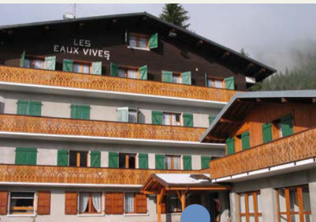
Centre les Eaux Vives Essert Romand 74110 MORZINE