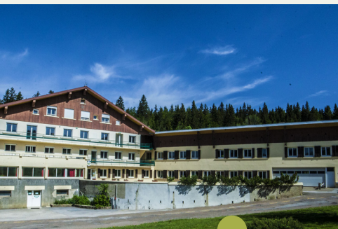
Ecole des Neiges 350 Chemin de l'Ecole des Neiges 39310 LAMOURA