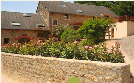
Association morvandelle du Croux 71990 ST-LEGER-SOUS-BEVRAY